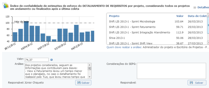
Figura 5: Funcionalidade de análise de indicadores consolidados com a lista de projetos e respectivos valores individuais do indicador selecionado.