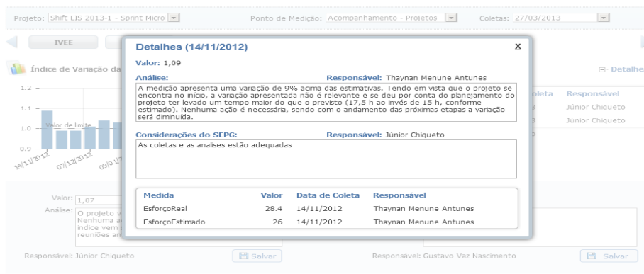
Figura 4: Funcionalidade de registro de interpretação e análise de indicadores com exibição de detalhes de um ponto anterior específico no tempo

de como estão os indicadores de prazo (estimado x realizado) de toda a organização, consolidando os projetos em andamento ou finalizados até uma determinada data (a organização seleciona quais projetos deseja consolidar). Nesta situação, é possível selecionar os projetos e o indicador que se deseja consolidar, assim, o Shift Metrics apresenta um gráfico com o resultado da consolidação e as análises podem prosseguir como apresentado anteriormente. Na Figura 5 está apresentada a funcionalidade de consolidação com a lista de projetos selecionados para ela.