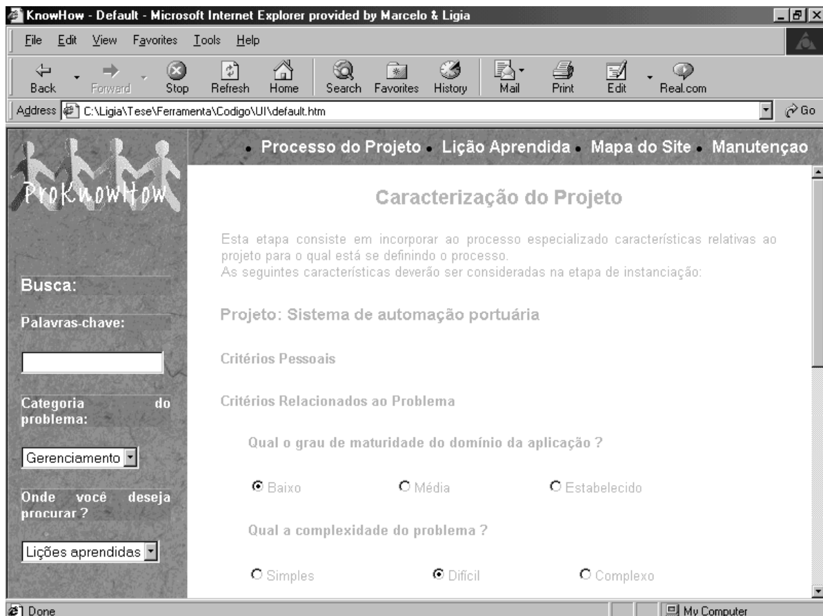
Figura 3 – Caracterização do projeto

Na definição de um processo de software para um projeto, deve-se considerar a seleção de um modelo de ciclo de vida. São inúmeros os modelos de ciclo de vida propostos na literatura e uma seleção inadequada pode influenciar no sucesso de um projeto. Neste trabalho, foram considerados apenas os modelos de ciclo de vida aprovados para uso no CDSV, sendo que, para a seleção, utilizou-se a sistemática definida em [5].