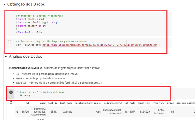
Figura 1. Obtenção e análise de dados

Outro fator relevante, visualmente, a ferramenta favorece que o estudante na elaboração de gráficos e tabelas. A Figura 2 ilustra exemplos de gráficos criados no colab . Na parte de cima de cada imagem, destacado em vermelho, apresenta o código inserido e em seguida pode ser compilado dentro deste bloco, sem afetar outras parte do arquivo (ou notebook ).