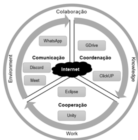
Figura 1. KWE dos Projetos P1 e P2

Os estudantes não utilizaram uma única plataforma integrada, mas construíram um ecossistema híbrido de ferramentas livres e de código aberto para dar suporte ao seu trabalho. Este ambiente, visualizado graficamente na Figura 1, que denominamos Knowledge Work Environment (KWE) ad-hoc . O conceito de KWE refere-se a sistemas que apoiam o trabalho do conhecimento, enquanto o termo ad-hoc descreve a natureza emergente do ecossistema criado pelos estudantes: um conjunto de ferramentas livres, não integrado formalmente, mas articulado pela Internet, que funcionou como a "cola virtual" entre as dimensões da colaboração.