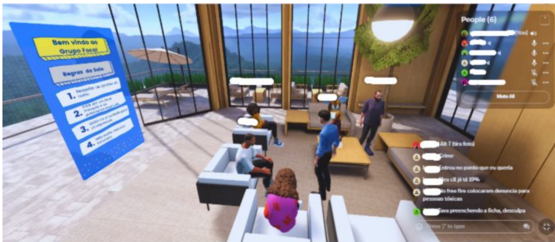
Figura 2. Discussão do Grupo Focal

e elementos naturais, priorizando conforto e foco, e outro com cores intensas, estímulos dinâmicos e sons intermitentes, para analisar efeitos sobre atenção e sobrecarga sensorial.