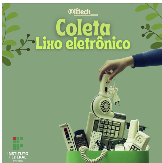
Figura 1. Cartaz de divulgação do projeto.