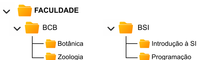
Figura 1. Prática sobre organização de pastas.

a) Manuseio e uso de computadores pessoais (1º dia): foram abordados os conceitos introdutórios de informática, acompanhados de atividades práticas de familiarização com o uso do computador. Para o desenvolvimento da digitação, utilizou-se a plataforma Typing.com , voltada ao treinamento de digitação, enquanto o treino do uso do mouse foi realizado com o auxílio do CPS Check , ferramenta para avaliação de cliques. Em relação ao sistema operacional Microsoft Windows , os cursistas realizaram atividades de organização de pastas no explorador de arquivos, estruturando diretórios com nomes de cursos e disciplinas, conforme ilustrado na Figura 1.