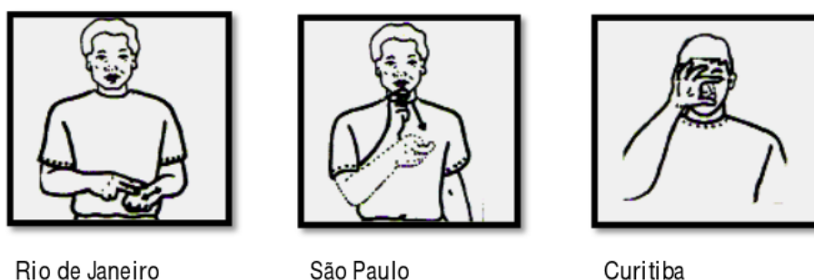
Figura 3. Variação regional do sinal da cor verde

busca identificar problemas na ferramenta que possam ser explorados. Para isso, serão utilizadas as técnicas de design participativo e design centrado no usuário. O design participativo será empregado para a construção da interface do protótipo da ferramenta. Essa prototipação se dá a partir da coleta de informações com o usuário para compreender as suas reais necessidades. Será utilizado protótipo de baixa fidelidade para apresentar o layout da tela. O design centrado no usuário, concentra as necessidades e requisitos nos usuários, com o objetivo de produzir ferramentas altamente utilizáveis e acessíveis.