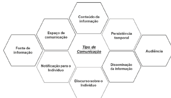
Figura 2. Disposição das dimensões de privacidade do MDP na representação visual de um tipo de comunicação

valores. Assim, algumas dimensões vão apresentar possibilidades de valores/cores que remetem a todos os níveis de privacidade, enquanto outras vão apresentar possibilidades de valores que remetem a apenas alguns desses níveis. Nesse caso, é feito um mapeamento valor-cor, de forma que o valor que remete ao nível mais alto de privacidade dentro da dimensão é sempre mapeado na tonalidade mais escura da cor e aquele que remete ao nível mínimo de privacidade é mapeado na tonalidade mais clara. Nesse caso, o valor referente ao nível intermediário de privacidade para a dimensão em questão será mapeado na tonalidade intermediária.