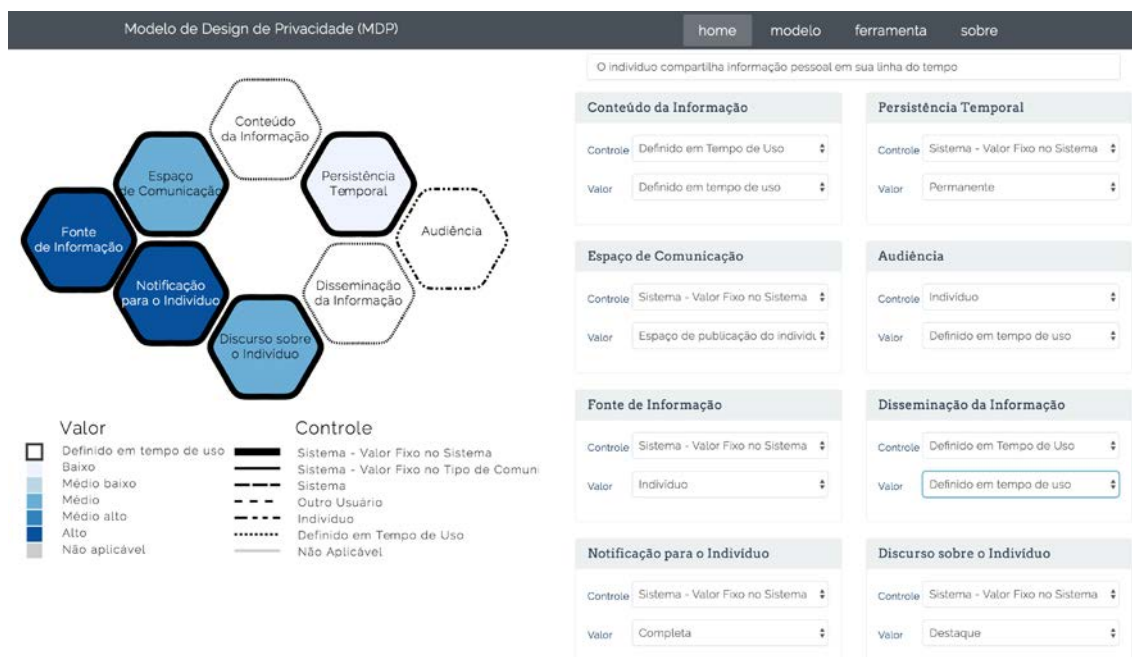
Figura 4. Protótipo da ferramenta de visualização do MDP: versão inicial

Com o objetivo de facilitar a criação e avaliação da representação visual e do próprio MDP, desenvolvemos a PryMeVis, uma ferramenta para modelagem e criação de uma representação visual online do MDP 5 . Nessa ferramenta, o designer pode modelar cada tipo de comunicação referente a uma oportunidade de compartilhamento de informação pessoal dentro da RSO, fornecendo valores para os atributos “controle” e “valor” de cada dimensão do MDP. Com base nos valores fornecidos através da interação direta com a interface, PryMeVis representa visualmente os tipos de comunicação, como mostrado na Figura 4. A única diferença entre a representação visual apresentada na seção anterior e a utilizada na PryMeVis é o uso da paleta sequencial 6 de cores com diferentes intensidades em tons de azul, ao invés dos tons de cinza, que ocorre puramente por questão estética. Também foi utilizado o padrão fade (em tom de cinza) para representar o valor “não aplicável” na visualização.