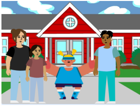
Figura 3: História do menino de 4 anos.