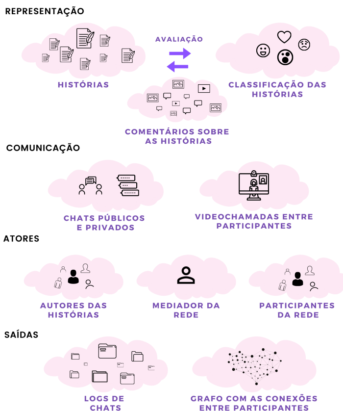
Figura 2: Estrutura do sistema de apoio ao Framework StoryGirl

O Framework StoryGirl é uma iniciativa originada em um projeto de extensão ainda em fase inicial em uma Universidade Federal do Brasil. Neste projeto, o principal objetivo é apresentar para crianças e juvenis (especialmente meninas, mas não exclusivo) de 4 – 15 anos o universo da programação de computadores através de uma linguagem em blocos: o Scratch. Este projeto estimula o interesse das crianças para a programação através da contação de histórias ( storytelling ), e estas mesmas são animadas pelas crianças usando as técnicas da programação em blocos. Essas histórias podem ser de qualquer temática, tendo como único pré-requisito ser uma história real.