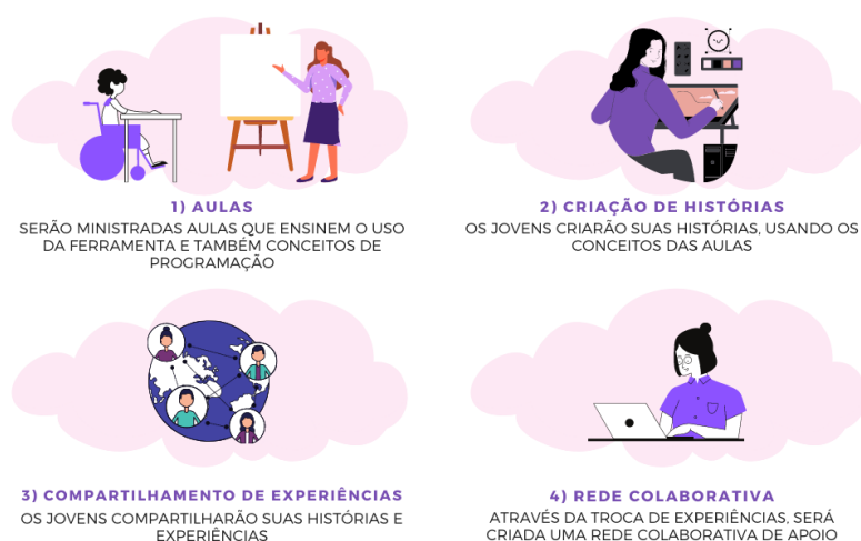
Figura 1: Framework StoryGirl