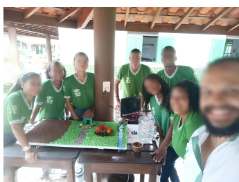
(a) Projeto 1.

Para apresentar os projetos desenvolvidos, foi realizada uma Feira Agro Tecnológica na praça de Igrapiúna - BA, onde a escola está situada, conforme ilustrado na Figura 1. Este evento contou com a participação de várias escolas e foi aberto a toda a população da cidade.