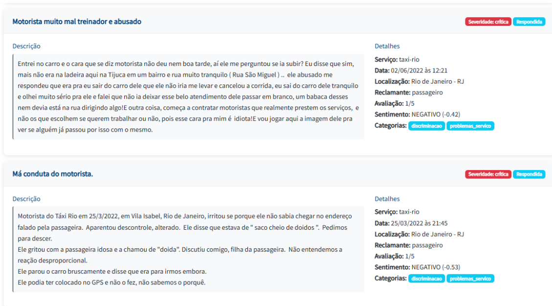
Figura 3. Exemplo com indícios de discriminação e redlining (Figura 6.10 da Dissertação)