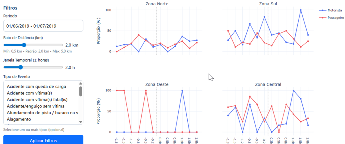
Figura 4. Comportamento dos cancelamentos em relação aos eventos urbanos por zona (Figura 6.17 da Dissertação)