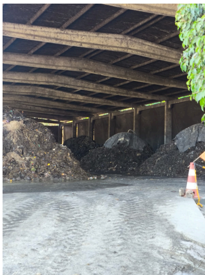
Figura 1. Leiras de compostagem com tecnologia de sucção negativa para controle de gases. O estágio final da decomposição (30 dias) é observado na extremidade direita da figura.

do processo de decomposição por isso possuem tubos para captação dos gases liberados pelo processo de compostagem.