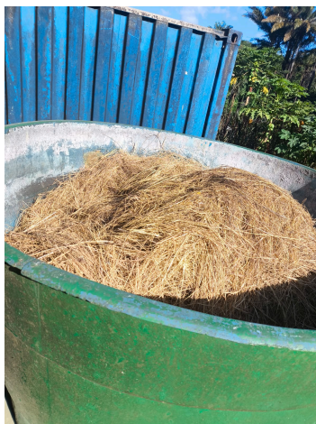
Figura 2. Biofiltro de palha de melancia para tratamento e purificação dos gases efluentes antes da liberação na atmosfera.

A figura 2 mostra o biofiltro de palha instalado no final da canalização dos gases pela Lógica Ambiental.