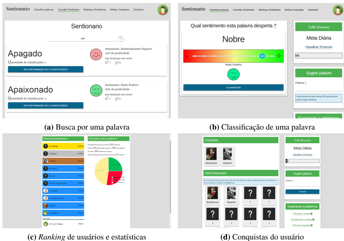
Figura 1. Exemplos de interfaces do Sentionario

está representada na Figura 1a. Essa interface tem como objetivo permitir ao usuário buscar um termo na plataforma e visualizar o sentimento correspondente de acordo com as classificações de outros usuários. Essa interface também mostra outros dados como a quantidade de classificações e a distribuição dessas em um gráfico de escala de sentimento. O sentimento observado em cada termo varia em uma escala que vai de 0% a 100% de positividade. Esse valor é obtido por meio da média das classificações dos usuários que o avaliaram. Além disso, é permitido ao usuário visualizar a distribuição das classificações atribuídas a um termo.