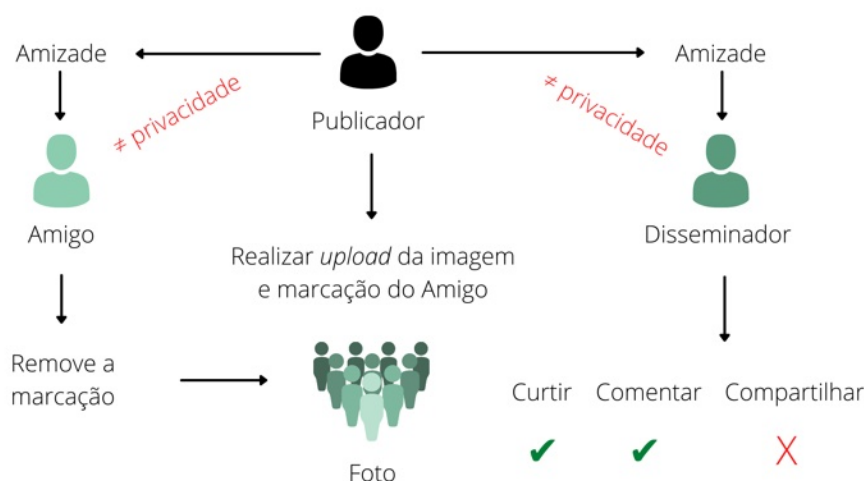
Figura 1 - Inserindo marcação de TAG no Facebook.

Por último, o terceiro cenário, onde o Publicador altera as configurações padrões dos usuários que têm acesso à publicação, tornando-a pública e disponível para toda a rede social, existe uma extrapolação do alcance e visibilidade da foto para além do círculo social do Publicador mesmo após a remoção da TAG pelo seu amigo. Como resultado, o Disseminador consegue compartilhar a publicação. Vale ressaltar o primeiro e segundo cenários a serem exemplificados utilizaram a configuração padrão de compartilhamento somente com os amigos do publicador. No terceiro cenário a configuração padrão de compartilhamento foi alterada para o público em geral do Facebook.