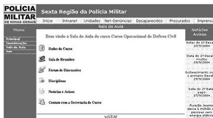
Figura 2. Web PM: Um Protótipo que deu certo

Todos os cursos são semi-presenciais, com no mínimo dois encontros presenciais, com a fase a distância gerenciada pelo Web PM. Segundo [Santos 2005], “...o Web PM é uma prova de que as tecnologias disponíveis hoje não inviabilizam a capacitação profissional.” Com isso a Polícia Militar pretende maximizar a capacitação de seus colaboradores internos, expandir esta capacitação a seus colaboradores externos, atingindo todo sua cadeia de valores.