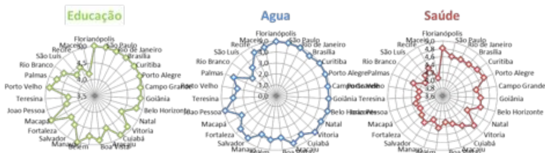
Figura 1. SCMM: Comparação de Domínios entre Capitais Brasileiras.

Desta forma, analisando o nível inicial deste modelo de maturidade é possível indicar quais cidades necessitam ajustar suas práticas específicas e gerais para alcançar melhores notas nos domínios desejados e se for do desejo dessas cidades, buscar índices mais próximos das demais capitais.