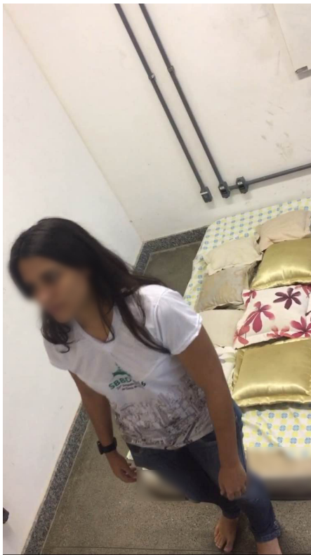
Figure 4: Usuário em preparação para uma queda de costas. Figura Elaborada pelo autor (2016).

Para avaliar o algoritmo de detecção de quedas implementado, foi realizado o seguinte experimento, composto de três etapas: