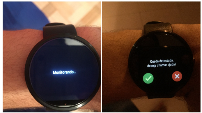
Figure 3: Na ordem, telas de monitoramento e queda detectada. Figura Elaborada pelo autor (2016).

Este módulo é responsável pelo envio de e-mails e a manipulação de arquivos com os dados de uma queda. Para que se possa realizar o envio de e-mails, foi criado um email padrão do SafeWatch. O envio de e-mail é feito de forma assíncrona, sem bloquear a interação do usuário com a aplicação. O modelo do email, além de enviar uma mensagem informando que o usuário pode está em uma situação de perigo, um link do Google Maps é anexado com a última localização do usuário obtida pelo sistema.