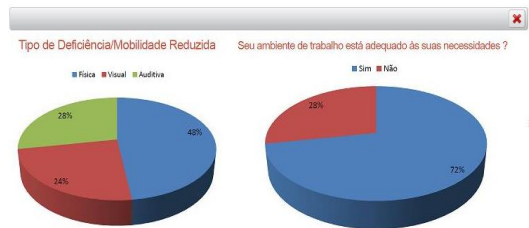
Figura 4. Gráficos ampliados.

O pesquisador solicitou a V1 que clicasse no link “Gráfico SGP.jpg”, onde foi aberta uma janela contendo duas imagens (Figura 4). A primeira tinha informações sobre o tipo de deficiência/mobilidade reduzida com três legendas (uma na cor azul referindo-se à deficiência física; a outra na cor vermelha sobre deficiência visual e outra na cor verde que se referia a deficiência auditiva).