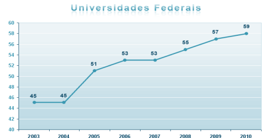
Figura 2. Expansão da rede federal de educação superior.

Foi apresentado para V1 uma página web contendo um texto acima da imagem gráfica a V1 (Figura 2). O texto descrito na página não tinha nenhuma relação com as informações gráficas. No elemento <alt> associado a imagem gráfica estava descrito “ gráfico expansão ”.