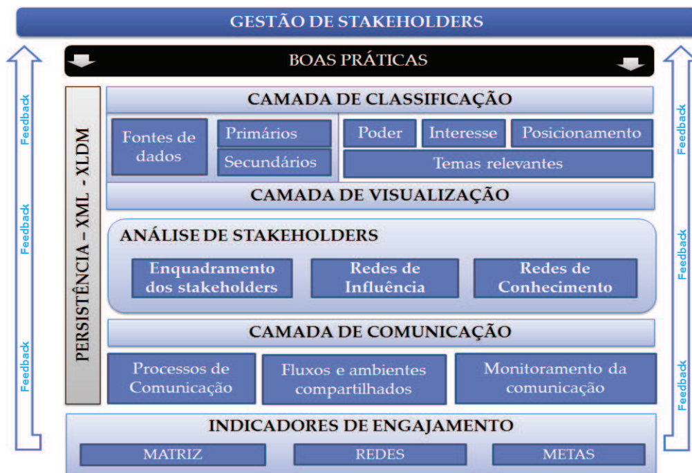
Figura 2. Ambiente de Visualização de Dados Sociais

(RSC), que permitem o monitoramento e gestão contínua das relações entre as organizações, seus projetos e as partes interessadas, promovendo os meios para atuar mais ativamente no fortalecimento dessas relações, através do monitoramento das dinâmicas sociais frente as decisões de projeto e seus impactos. Estes indicadores fornecem o feedback necessário para realinhar as estratégias de gerenciamento, de modo a mitigar resistências e gerenciar riscos ao longo da execução ou término de um projeto. A Figura 2 apresenta a arquitetura do ambiente proposto.