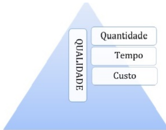
Figura 01: A qualidade efetivada nas bases da produtividade