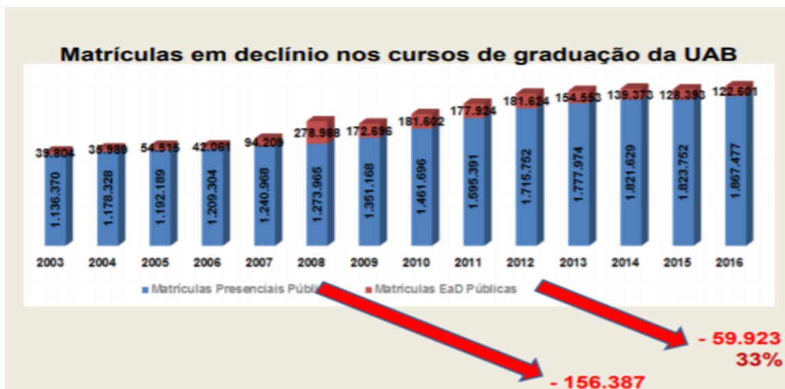
Figura 03: Paralelo Matrículas IES Públicas e Alta no Mercado EaD

expansão do mercado da Educação a Distância, sobre o qual traça analogia entre a redução das matrículas nas instituições públicas. Análise caracterizada nas imagens a seguir: