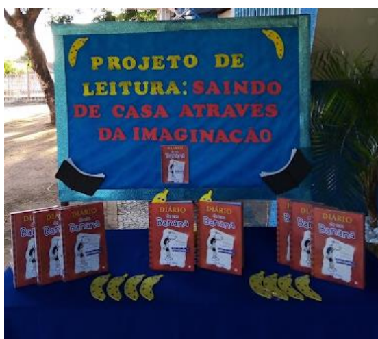
Figura 1: Entrega dos livros

As entregas dos livros aconteceram na unidade escolar, em dia e horário agendado, a professora realizou as entregas e conversou com as famílias reforçando a metodologia que seriam desenvolvidas pelo projeto “Saindo de casa através da imaginação”;