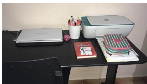
Figura 2: Cantinho da leitura 1

Foram lançados desafios para os educandos, o primeiro teve uma ligação direta com a família, a criação do cantinho da leitura de cada um, foi emocionante as ideias que os alunos e a família tiveram para completar o desafio e criar o seu cantinho da leitura.