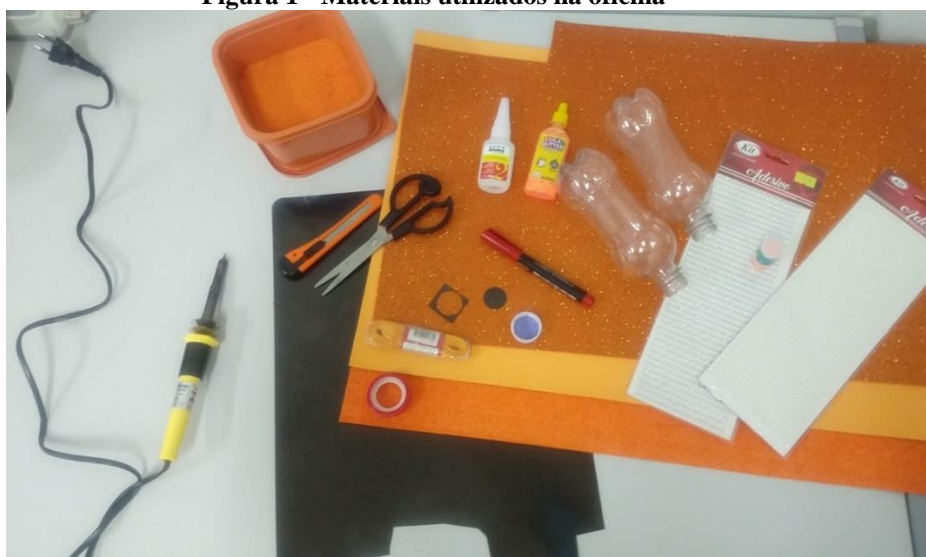
Figura 1 - Materiais utilizados na oficina

Na sequência, foi disponibilizado e apresentado aos estudantes todos os materiais necessários para a confecção da ampulheta do tempo: duas garrafas pets de 500 ml (mililitros) descartáveis sem tampas, diversidades de EVA, tesoura, estilete, régua, lápis, compasso, caneta marcadora, cola de silicone, cola adesiva instantânea, fita adesiva colorida, fitas de cetim, areias coloridas, glitter (brilho) colorido, molde da tampa em material firme (utilizamos raio-x) usado, para ser perfurado por um pirógrafo e algumas pedrarias como pérolas e strass para enfeites e detalhes (Figura 1).