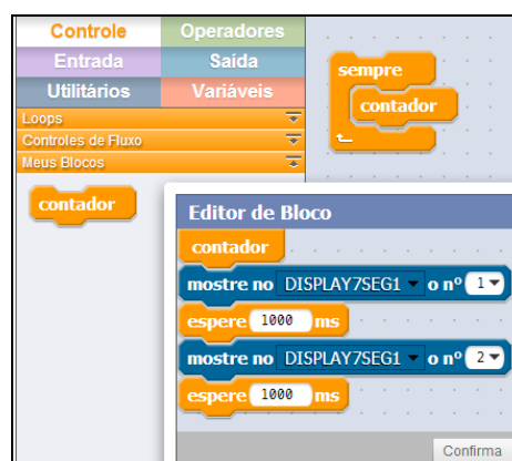
Figura 3. Módulo Editor de Bloco