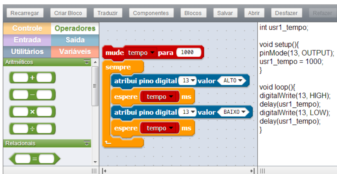
Figura 1. Layout do Ambiente DuinoBlocks.

A Figura 1 mostra o layout do ambiente DuinoBlocks, com um exemplo de algoritmo (Pisca Led) bastante conhecido na RE. O layout é dividido em 5 painéis: o rodapé (contém botões que controlam a disposição dos painéis); o cabeçalho (barra de ferramentas com botões que realizam ações no software); o esquerdo (contém uma lista de blocos separados por categorias e subcategorias); o central (área de construção do algoritmo); e o direito (contém a tradução textual do algoritmo em Wiring).