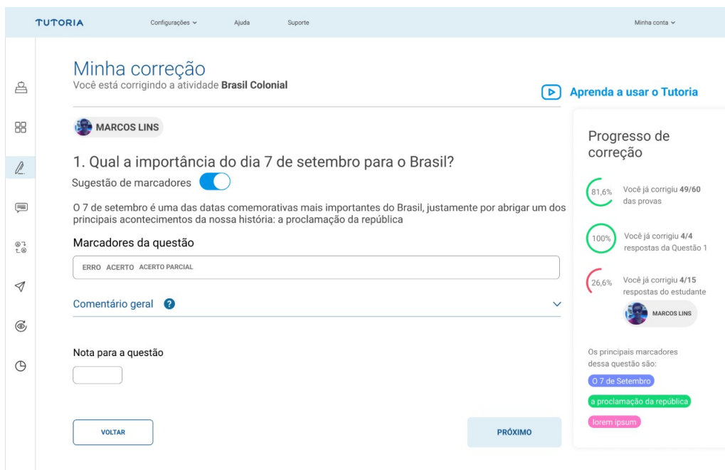
Figura 2. Tela de correção de questão aberta.