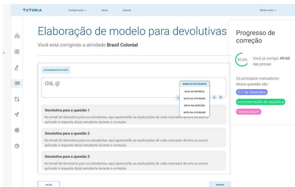
Figura 5. Tela de elaboração de devolutiva.

quantos blocos textuais achar relevante para conectar os diferentes blocos de feedback por questão.