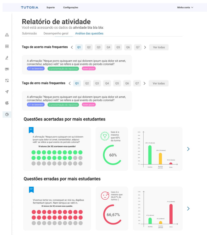
Figura 6. Dashboard com estatísticas da turma.

Scale (SUS) [Grier et al. 2013]. Como resultado, a plataforma obteve 73 pontos, que é considerado um bom indicativo de usabilidade.