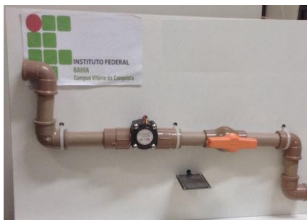
Figura 1. Protótipo com sensores de vazão e umidade

Os dados são capturados através de sensores que ficam instalados ao longo das tubulações de água em pontos estratégicos da residência (cozinha, banheiro, área de serviço). A Figura 1, apresenta o protótipo utilizado nos testes iniciais, sendo que estes sensores possuem a capacidade de medir a vazão da água e também identificar a presença de líquido fora da tubulação, indicando se há vazamentos ou não.