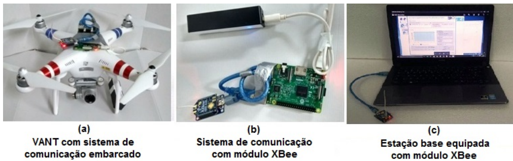
Figura 1. Dispositivos utilizados para os testes da arquitetura de hardware .

o sistema conta com antenas omnidirecional filamentosares de ganho 1,5 dBi. O uso de antenas omnidirecionais proporciona uma maior capacidade de recepção das aeronaves e a estação terrena, uma vez que, permite receber a mesma potência do sinal independente da direção que o VANT se desloca. O sistema conta com um receptor com sensibilidade de -100 dBm permitindo um maior raio de atuação das aeronaves.