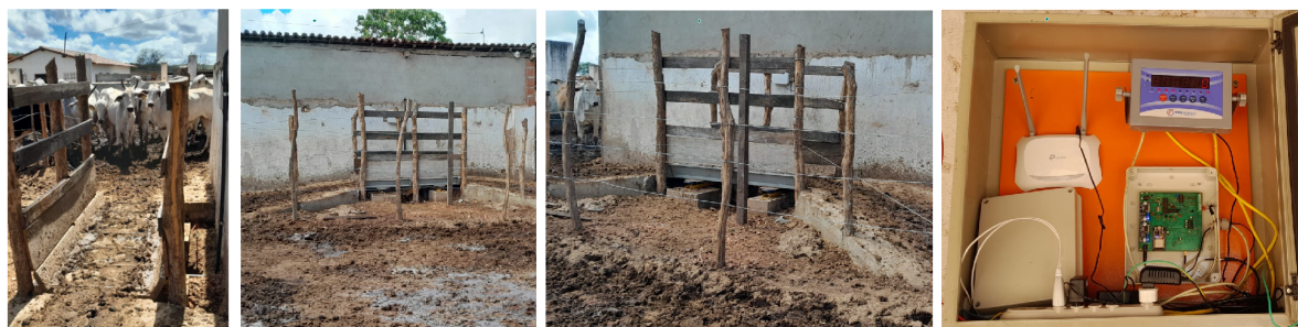
Figura 3. Detalhes da balança.

O InteliCampo destaca-se no cenário da gestão pecuária por incorporar funcionalidades inovadoras que atendem às necessidades específicas dos produtores rurais. Seus principais diferenciais incluem: