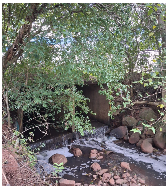
Figura 3. Local dos Experimentos.

O sensor de temperatura também apresentou resultado satisfatório já que é um equipamento semelhante àquele utilizado comercialmente para medições (OKPARA, 2020). A medida realizada pelo sensor comercial foi de 26°C em média enquanto pelo equipamento construído foi de 26,1°C em média. Essa temperatura reflete bem a característica do local, já que se trata de um recurso com pouco volume de água e baixa vazão. A figura 3 mostra o local e como os sensores foram posicionados.