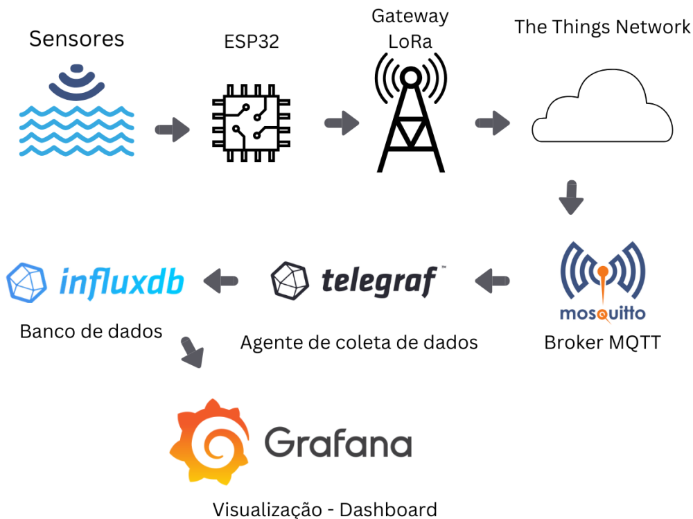
Figura 2. Esquemático do sistema de aquisição de dados (fonte: os autores).

Na camada final, a plataforma Grafana conecta-se ao InfluxDB via consultas em linguagem Flux. A ferramenta transforma os registros armazenados em painéis dinâmicos, funcionando como um recurso pedagógico de educação ambiental ao permitir a correlação visual imediata entre os diferentes parâmetros hidrológicos monitorados. O funcionamento integrado das etapas de coleta, processamento, armazenamento e visualização está esquematizado na Figura 2.