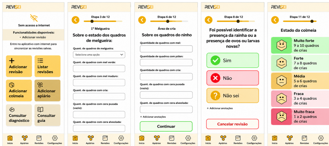
Figura 2. Exemplo do fluxo guiado de inspeção no Reverse! com algumas das etapas sequenciais do formulário.

de revisão, no caso, estado da melgueira, estado do quadros do ninho, presença da rainha e estado geral da colméia.