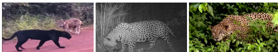
Figura 1. Exemplos de imagens presentes no dataset , evidenciando diversidade de cenários e condições.