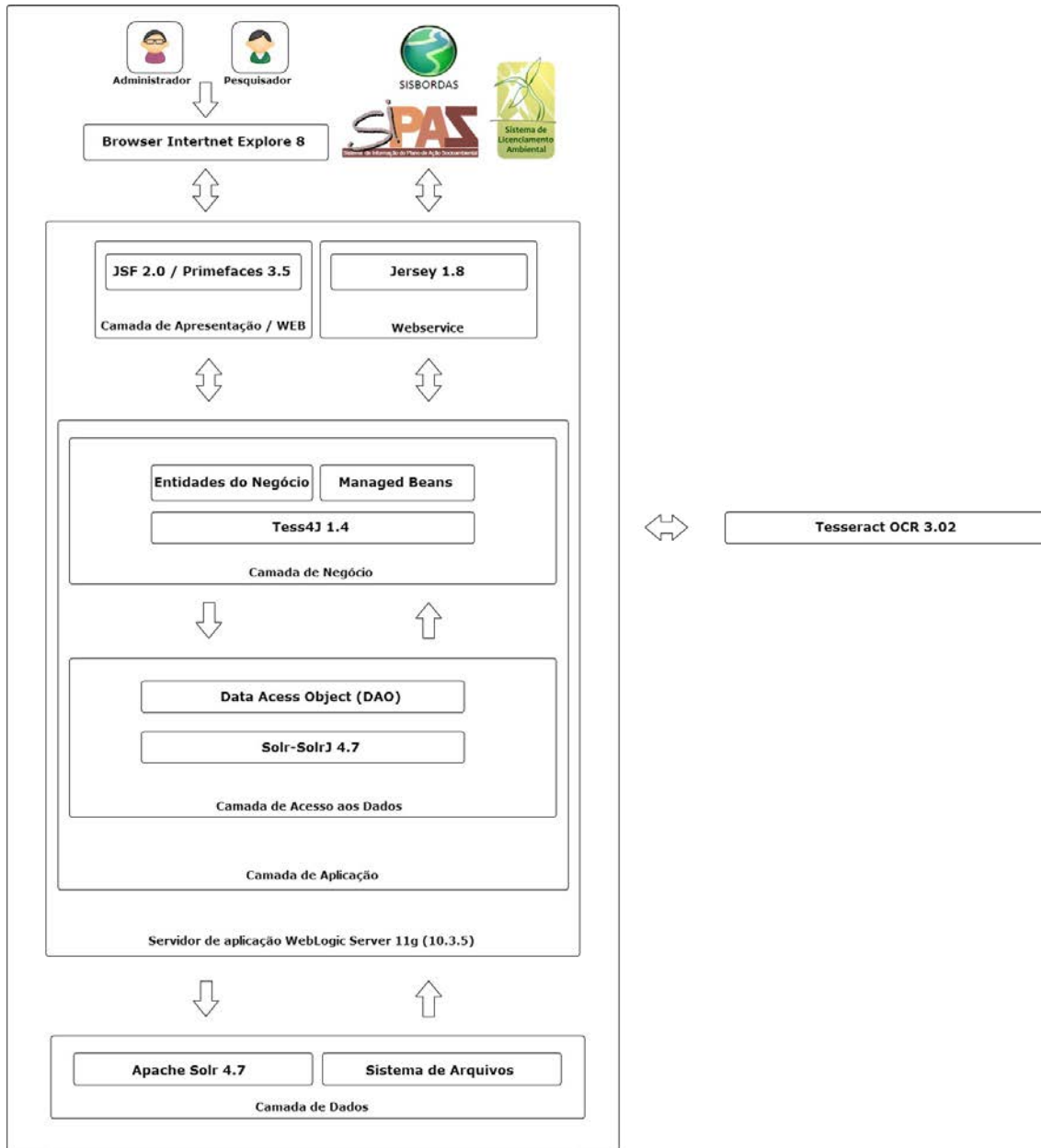
Figura 3. Arquitetura do SISDOC.

Tesseract e a aplicação no Weblogic foi utilizado o Tess4J 1.4.