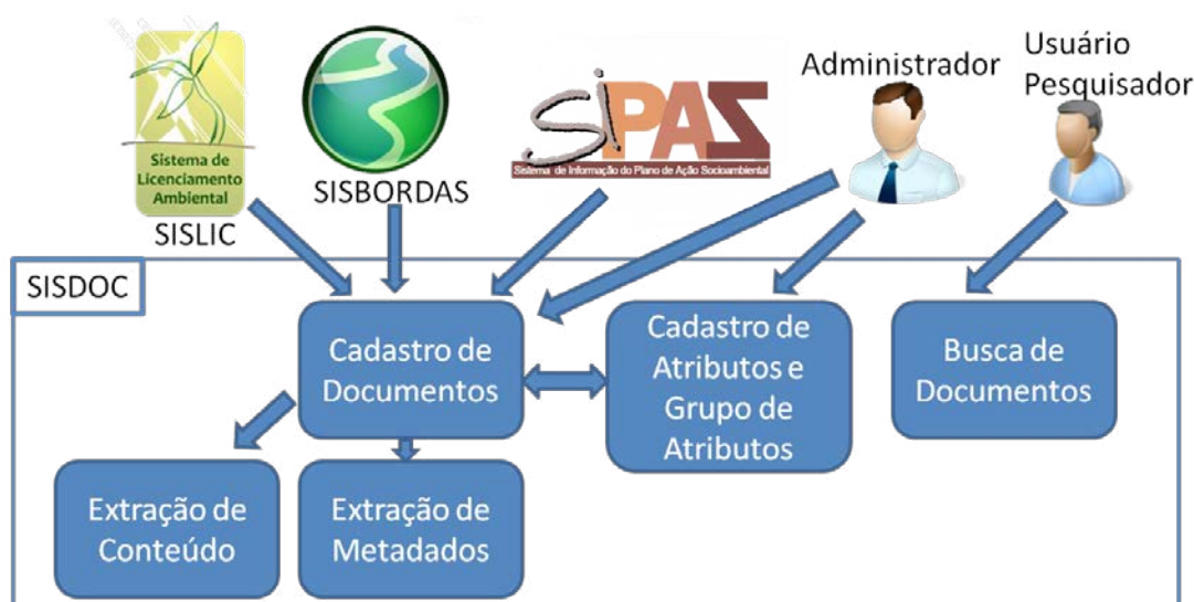
Figura 2 - Visão geral do SISDOC.

O SISDOC foi desenvolvido para ser executado em uma plataforma Java EE 5 e Java SE 6, sendo testado utilizando-se o servidor de aplicações Oracle Weblogic 10.3.5.