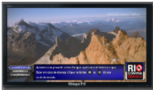
(a) Aplicação sobre Saúde da PRODERJ.

A Figura 1, a seguir, ilustra dois exemplos de aplicações interativas para TV Digital, oriundas de duas instituições diferentes, que seguem o template proposto de exemplo, o qual chamaremos “Botão-Texto-Imagem”. Em ambas as aplicações, há um menu de botões. Quando um desses botões é selecionado (ou ganha o foco) usando as teclas direcionais do controle remoto, um texto e uma imagem respectivos são apresentados, desaparecendo com o texto e imagem que estava sendo exibido anteriormente. O primeiro botão faz aparecer um primeiro texto e imagem respectivos. O segundo botão faz aparecer outro texto e imagem respectivos e assim por diante, para todos os botões. Os textos e imagens são exibidos sempre na mesma região da tela. Esse padrão de interação é comum em aplicações interativas para TV digital, conforme pode ser visto em algumas submissões do Clube NCL [3], um repositório público de aplicações para o Middleware Ginga-NCL, padrão do Sistema Brasileiro de TV Digital. As telas das aplicações descritas na Figura 1 foram extraídas desse repositório.