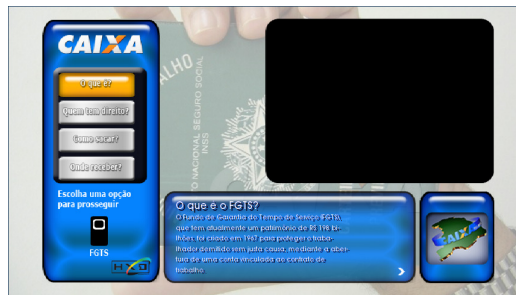
(b) Aplicação de Serviços da CAIXA®.