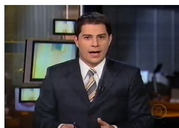
Figura 1 – Quadro-chave extraído do vídeo

O extrator foi aplicado a um conjunto aleatório de 10 vídeos da base segundo os seguintes critérios: um quadro-chave a cada quadro do vídeo; um quadro-chave a cada dez quadros; um quadro-chave a cada dois segundos. Assim, para cada vídeo, foram gerados três sub-conjuntos de quadros-chave.