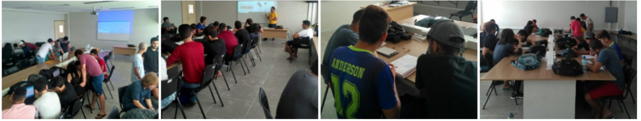
Figura 2. Momentos das atividades

seguidor de linha, como facilitadores de aprendizagem.