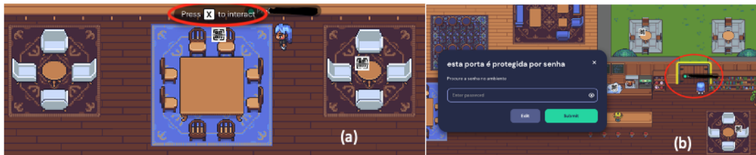
Figura 1. (a) Interação com os objetos. (b) Porta da sala com senha.

e 7 pistas falsas (para dar mais complexidade à dinâmica). Todos os itens (perguntas, respostas, pistas e dicas) foram inseridos em objetos de QR Codes dentro das salas, os quais deveriam ser identificados e acessados pelos alunos (Figura 1a). O professor também criou uma porta de entrada para uma sala que continha uma chave, conforme a Figura 1b. Para obter a chave, os participantes deveriam resolver um enigma, que também abordava o conteúdo da disciplina.