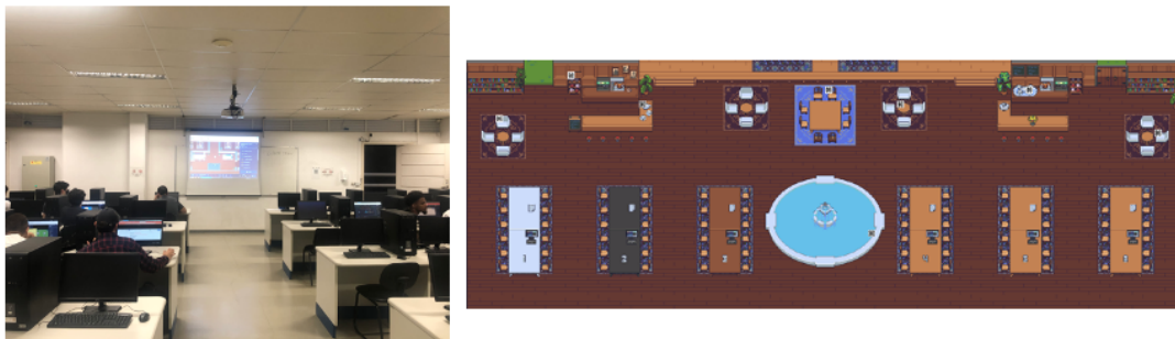
Figura 2. Alunos no presencial e mesas com números para cada grupo.

No dia reservado para a avaliação, todos os grupos estavam preparados e seus integrantes logados no Gather (presencialmente ou remotamente). O tempo total para resolução e entrega da avaliação seria correspondente ao tempo de aula (4 horas). O professor informou que, em uma das salas, os grupos encontrariam mesas com números específicos referentes a cada um deles. Estas mesas correspondiam a um ambiente de interação privado dos participantes, no qual poderiam colaborar por vídeo ou chat com os demais integrantes do grupo. Além disso, havia nas mesas um computador com acesso a um documento Google Docs , já compartilhado com o professor para acompanhamento e análise das respostas. A Figura 2 mostra os alunos presencialmente no laboratório e as mesas privativas de trabalho dos grupos.