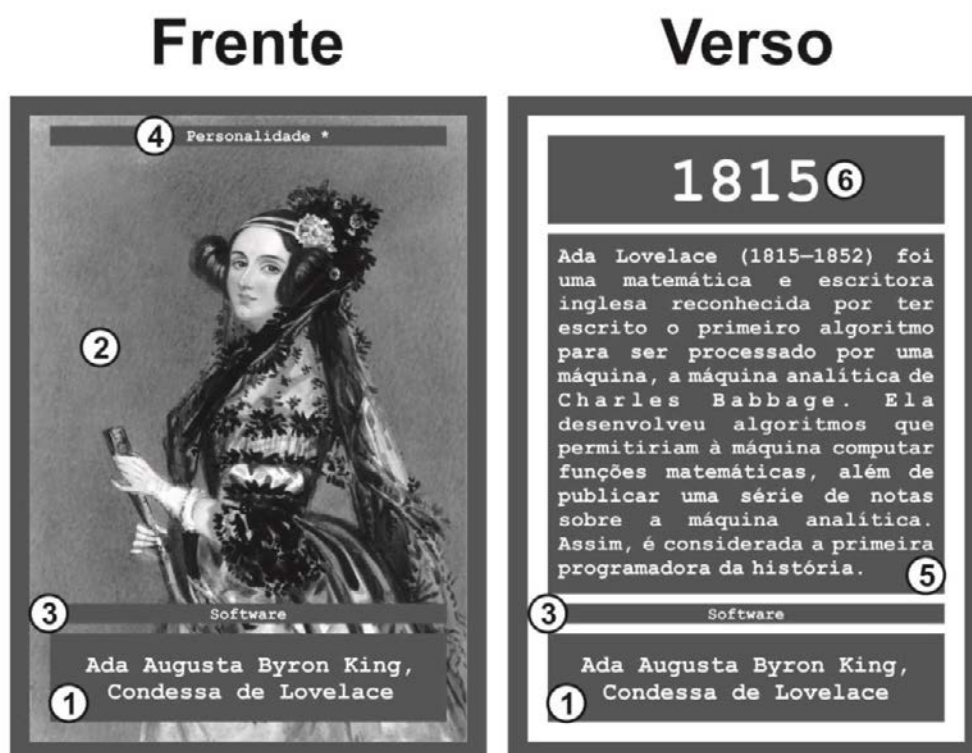
Figura 1. Exemplo de carta do jogo Computasseia e seus elementos indicados

As Categorias podem ser observadas na parte superior da visão da frente das cartas (ver item 4 na Figura 1). A Figura 2 apresenta um exemplo de carta do jogo de cada uma das três categorias citadas.