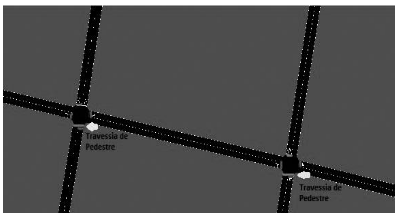
Figura 2. Tráfego com duas junções

A proposta do presente artigo, tomando como base o trabalho Ahmad et al. (2009), propõe estender a aplicação do algoritmo, em um primeiro momento, para duas junções de tráfego, como apresentado na Figura 2, e posteriormente para os demais semáforos do centro da cidade de Rio Grande/RS, nos modos estático e dinâmico de um AG. Para o desenvolvimento deste trabalho utilizou-se o modelo do algoritmo do trabalho referenciado, sendo que a linguagem definida para a implementação foi Java , visto que dentre as suas diversas características, a independência de plataforma e a portabilidade são requisitos interessantes no auxílio do problema em questão.