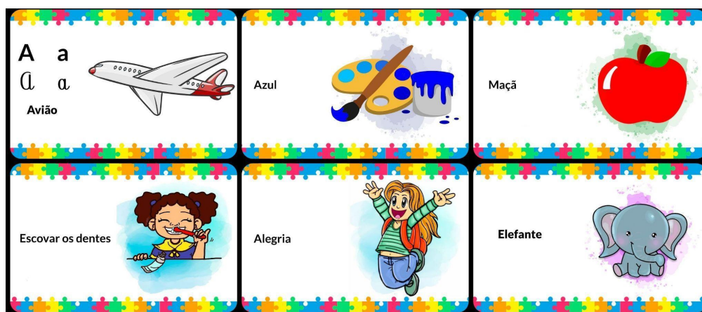
Figura 3. Cartões RFID

simples do cotidiano; expressar sensações e emoções, bem como melhorar a habilidade de comunicação da criança.