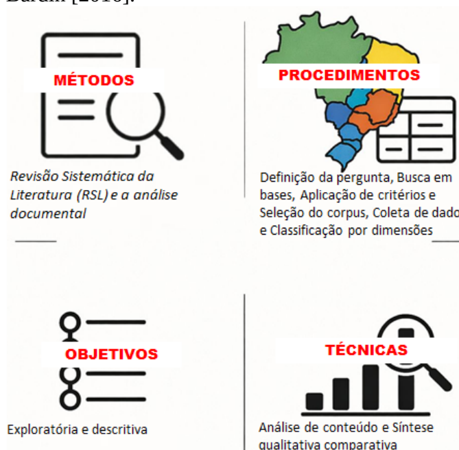
Figura 1. Classificação da Pesquisa

processos de regulamentação tecnológica, permitindo examinar evidências de institucionalização da governança da IAGen. A abordagem qualitativa é particularmente pertinente para a análise de fenômenos complexos em seus contextos institucionais e sociais [Creswell 2014], sendo a análise documental conduzida conforme orientações metodológicas de Bardin [2016].