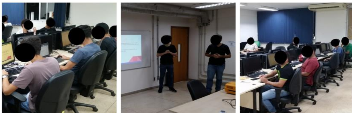
Figura 1(a) – formação GV/GO