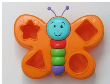
Figura 2. Brinquedo utilizado no problema

O brinquedo o qual se trata na situação estava a disposição dos participantes no momento da experiência, a Figura 2 traz a imagem do brinquedo mencionado.