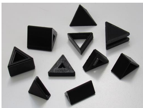
Figura 6. Peças construídas pelos participantes

Quando os alunos são desafiados com uma situação problema, onde precisam criar suas estratégias de resolução, também é instigado a criatividade desses alunos, nesta experiência os pesquisadores se surpreenderam com a originalidade das peças.