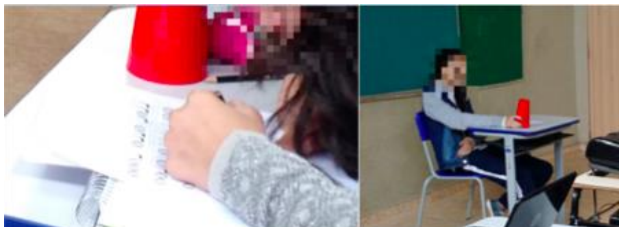
Figura 1. Atividade “Decifra o Ritmo”

A Figura 1 ilustra a aplicação da atividade “Decifra o Ritmo” e a Figura 2 ilustra a aplicação da atividade "Fluxo do Ritmo".