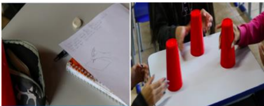
Figura 2. Atividade “Fluxo do Ritmo”

O instrumento avaliativo foi desenvolvido com a intenção de coletar dados sobre as quatro habilidades pilares do PC (abstração, decomposição, reconhecimento de padrões e algoritmos) e conhecimento sobre conceitos de programação antes e depois da aplicação da proposta de intervenção (atividades desplugadas com a música). Portanto, o