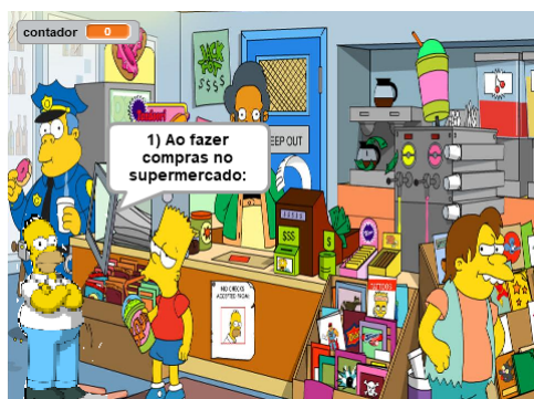
Figura 1. Segunda tela do OA