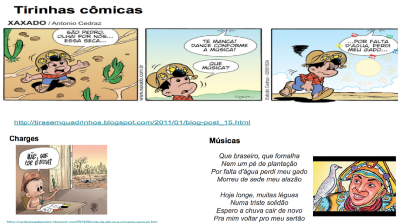
Figura 1. Metodologia do Projeto Grupo 1

Os projetos apresentados demonstraram um caráter interdisciplinar, abordando o tema cidadania planetária em diversas disciplinas, além de utilizar os recursos tecnológicos no seu desenvolvimento. O grupo 1 utilizou charges e músicas que abordaram a seca, o uso consciente e sustentável da água, abordando o caráter interdisciplinar dos componentes do grupo, formado por profissionais das áreas da saúde, matemática e educação (Figura 1). A metodologia sugerida envolveu diferentes estratégias que os alunos podem vivenciar no dia a dia para práticas sustentáveis.