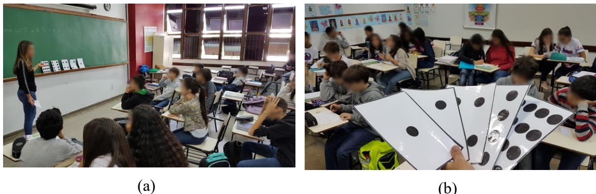
Figura 1. Foto ilustrando: (a) a demonstração de como utilizar os cartões binários e (b) uma das turmas do 8º ano trabalhando em grupo (duplas).

como propósito avaliar o conhecimento retido pelos alunos após um período. O tempo médio para realização do teste de retenção foi de 30 min.