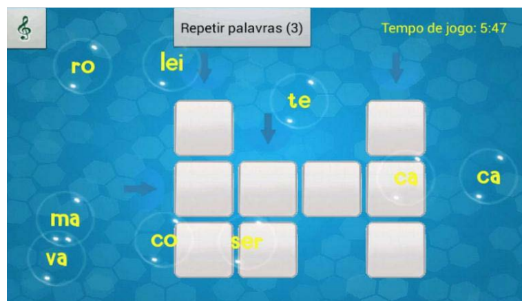
Figura 1 – Tela da simulação do jogo Aramumo

palavras cruzadas com sílabas, na qual cada criança deve formar as palavras arrastando para uma posição correta as “bolhas” de sílabas que flutuam pela tela (FIG. 1). O jogo trabalha quatro habilidades: separação silábica, ortografia, reconhecimento e memorização de sons e, coordenação motora.