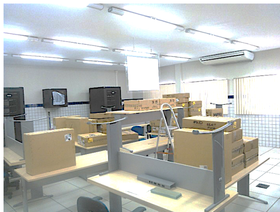
Figura 4 - Organização das mesas