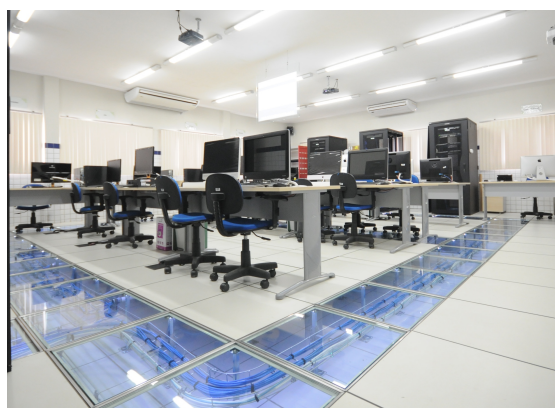
Figura 6 - Resultado final