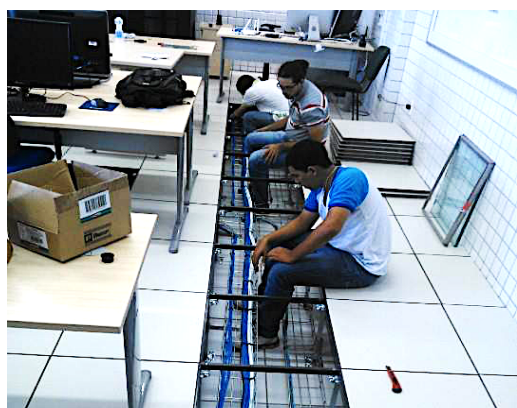
Figura 5 - Organização do cabeamento