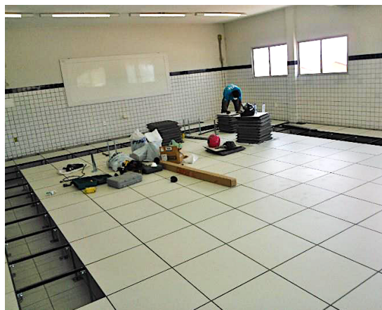
Figura 2 - Montagem do piso elevado