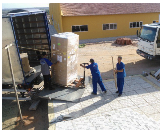
Figura 3 - Chegada dos equipamentos