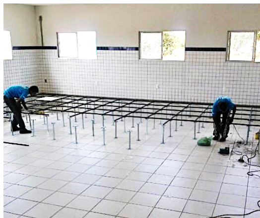
Figura 1 - Montagem do piso elevado