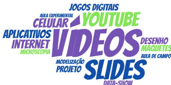
Figura 1: Nuvem de palavras construída a partir das respostas dos professores perante a situação 1.

Como exposto na figura 1, a seguir, na situação 1 (quadro 1) os professores deveriam tentar resolver o problema da dificuldade de compreensão do conteúdo de células com ilustrações. São inúmeros os recursos que ajudariam os professores, no entanto, a nuvem de palavras (figura 1) expõe que a opção eleita pelos professores é a utilização de vídeos, seguida de slides e do recurso Youtube.