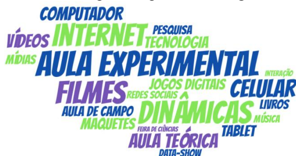
Figura 3: Nuvem de palavras construída a partir das respostas dos alunos de acordo com a situação 2.

tradicionais. Para essa análise, os resultados não contêm uma predominância de palavras evocadas, como mostra a nuvem de palavra presente na figura 3.