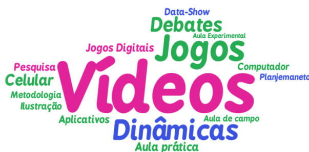
Figura 2: Nuvem de palavras construída a partir das respostas dos professores perante a situação 2.

Já na situação 2 (quadro 1), os professores entrevistados deveriam se colocar na posição dos alunos e tentar ajudar seu professor na promoção de novas metodologias de ensino, mudando, assim, a realidade precária das aulas de ciências. Conforme a nuvem de palavra (figura 2), a estratégia preferida pelos professores é, novamente, a utilização de vídeos, seguido de jogos e dinâmicas.