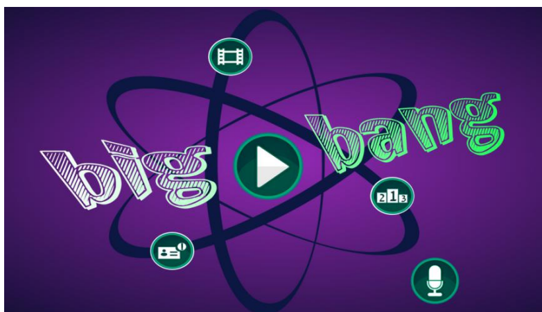
Figura 2. Tela Inicial do Jogo Big Bang

Big Bang 7 (Figura 2) é um software educacional de raciocínio, que envolve e estimula o estudante por meio de dicas que associam os elementos químicos a características e atividades cotidianas, para que o mesmo descubra o elemento químico em questão e os demais assuntos relacionados (organização da tabela e distribuição eletrônica). O intuito é fazer com que o estudante aprenda de maneira dinâmica e lúdica. O nome Big Bang foi adotado para o software por ser o nome da teoria de formação do universo. Apresenta relação com o tema do jogo (tabela periódica) por envolver elementos químicos, que estão presentes na tabela e, por sua vez, estão presentes na formação do universo.